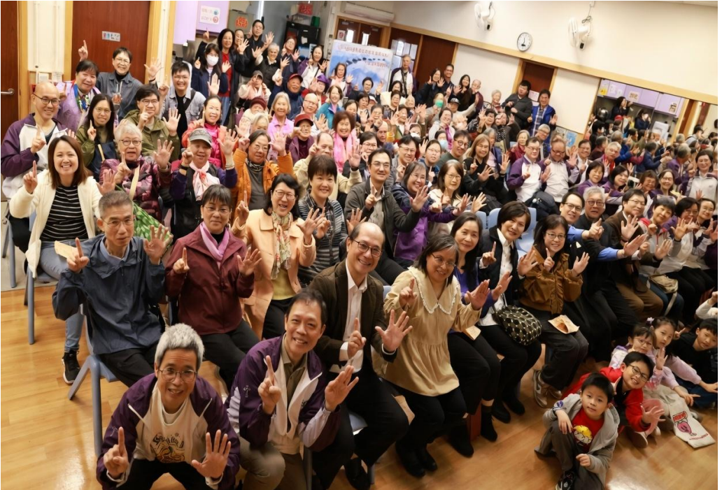
十五周年感恩崇拜大合照

2026年1月18日是石排灣福音中心十五周年誌慶，在筆者預備這篇的分享時，周年誌慶的聚會差不多完成了兩個月，很多觸動我們且值得回憶的片段仍不時浮現腦海，心中不禁發出讚美主的聲音。筆者有時候靜下來會問自己，我是誰？可以參與主的工，看見祂奇妙的工作。由籌備周年誌慶至今，詩篇127:1這節經文常提醒自己，「若不是耶和華建造房屋，建造的人就枉然勞力；若不是耶和華看守城池，看守的人枉然警醒。」。經文提醒我們，僅憑人自己努力的建造房屋或看守城池，一切都是枉然，惟單一的依靠主與配合祂的心意才能成就主的計劃。我們真的配不得甚麼。