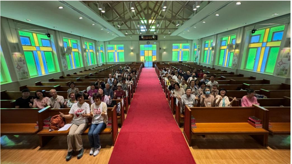
2026復活節福音遍傳出隊前合照

第二，教會必須組織自己，以表達她的自我理解，在教會結構上制訂一套反映她雙重身分的宣教策略，以促進弟兄姊妹可以來到基督面前敬拜，同時又為基督而出去宣教，好讓我們能在週日和週間的日子，在聚集與分散、來與去、敬拜與宣教的韻律中，展現教會神聖而在世的特質，具體地活出我們的雙重身分。教會要如何這樣組織起來，斯托得牧師建議，教會應當定期進行兩項調查，一個關於教會身處的社區，一個是關於自己教會，以期明白教會在多大程度上為基督進入社區，而教會領導層也可為教會訂下長期和短期的目標，列出先後緩急的行動清單，逐步推動會眾承擔教會在調查過程中所發現有關當地社區的某些特別需要。 2 斯托得牧師的建議，是比較著重一間地方教會，她如何組織起來履行向社區的鄰舍傳揚福音的責任。就此方面，感恩神引領我們堂會由疫情開始，開展了「福音遍傳」這個社區佈道的福音行動。近這幾年，每逢復活節和