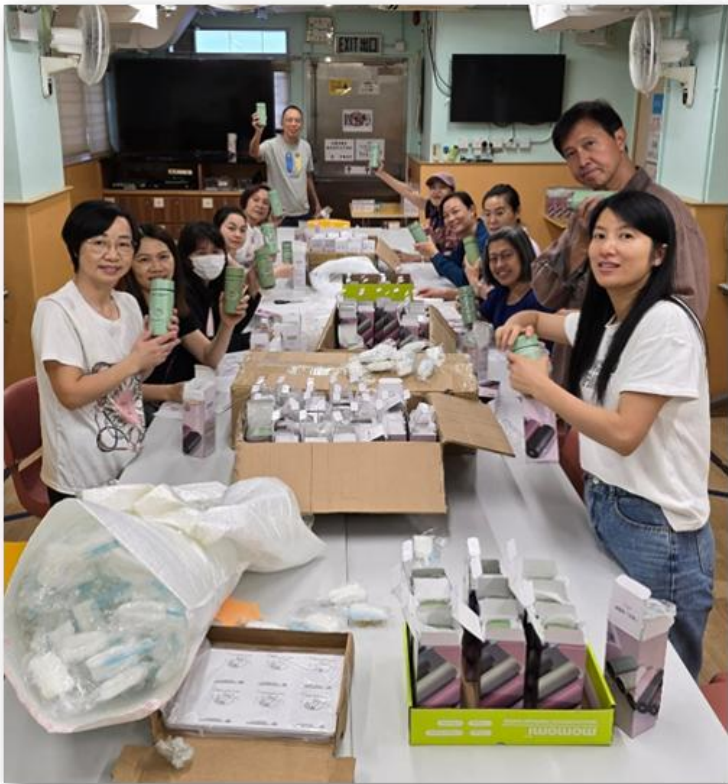
邀請家庭團契家長團友協助紀念品後期工作

恩典滿滿，還有如：我們邀請主日崇拜、長者團契、兒童團契和家庭團契不同的單位，協助拍攝宣傳短片，籌集周年誌慶聚餐的費用，很感恩我們可以一同經歷、一同參與拍攝，真是好的無比，最後所籌集的金額超出我們的目標有餘；我們邀請家庭團契的家長團友和事奉人員協助紀念品的後期工作，彼此的配搭，過程很順利的完成；當我們邀請事奉人員參與這次誌慶的活動，各人都積極回應參與....。還有許多許多的恩典，若是一一都寫出來，相信家訊的編輯一定叫我刪減一些內容。